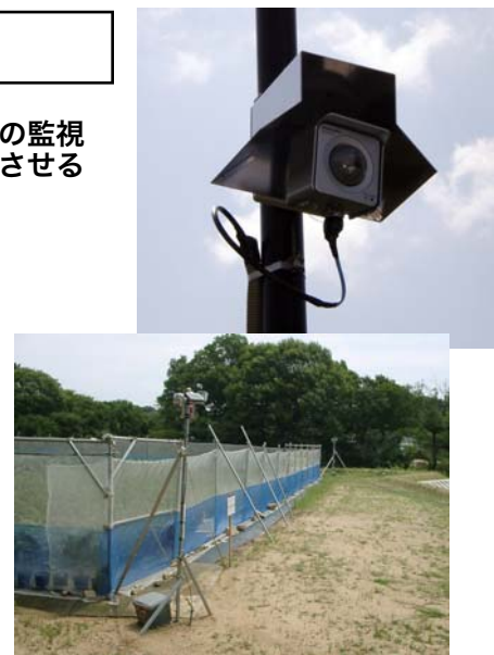
農園を囲むようにセンサーとカメラを設置