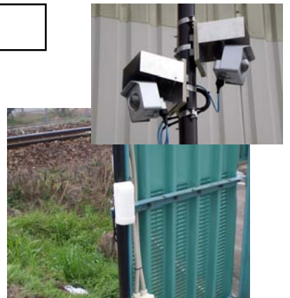
敷地内の開放箇所にセンサーとカメラを設置

また、携帯電話通知オプション等を使用することで、検知するとすぐにセキュリティ担当者へ画像付きのメールを送信することも可能です。