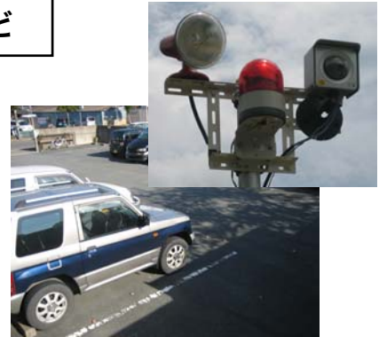
駐車場の敷地内にセンサーとカメラを設置

その他、人感センサーとワイヤータイプのセンサーを組み合わせることで、検知精度を上げることも可能です。