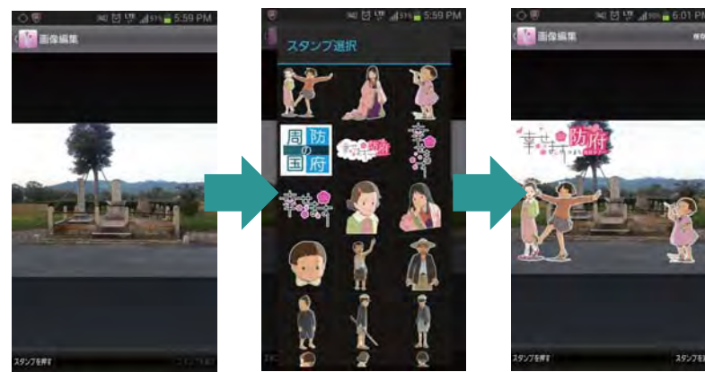
※画面は開発中のものです。

スタンプは、最初からアプリで利用できるものから、イベント期間限定配信、シークレット機能による隠しスタンプの配信なども可能です。