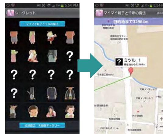
※画面は開発中のものです。