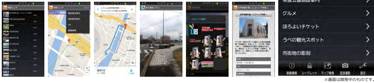
※画面は開発中のものです。