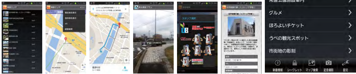
※画面は開発中のものです。